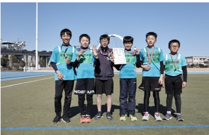
【駅伝・準優勝チーム】若草野球部