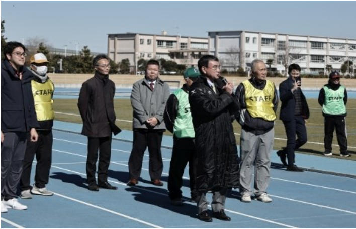
河野太郎 衆議院議員 ご挨拶