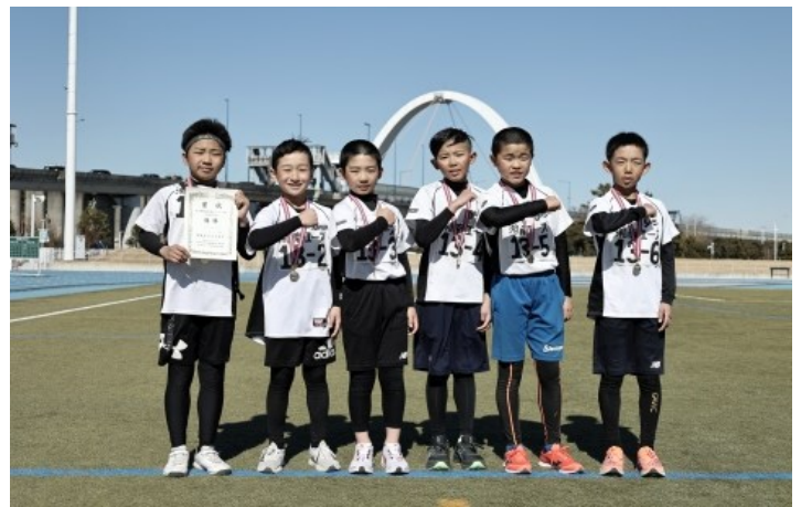
【駅伝・優勝チーム】湘南エース