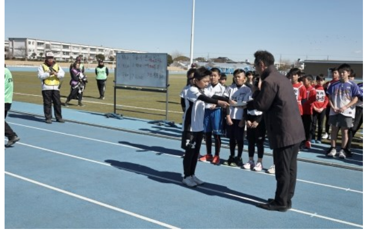
【駅伝】松が丘郵便局長より湘南エースへ表彰状授与